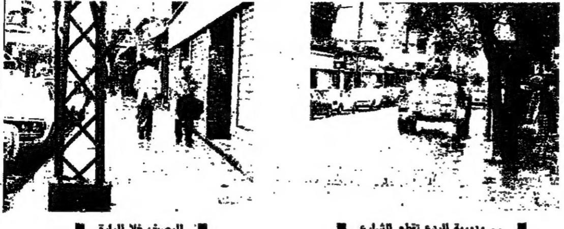
الرصف خلا للمارة